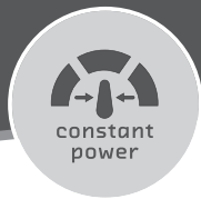
CONSTANT CUTTING POWER