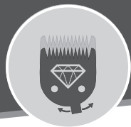
DIAMOND BLADE 0,7 - 3 mm